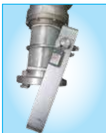
KAT 100 A / KAT 080 A