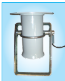
KAT 100 C