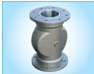
Vanne à manchon pneumatique VM

La vanne à manchon VM / VMM est utilisée pour fermer le tube de chargement du silo.