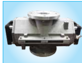
Vanne à manchon mécanique VMM

Si nécessaire, elle coupe immédiatement le flux d'air et de matériaux dans le tube de chargement.