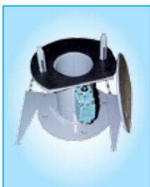
KAT 100 B

Pour le raccord de tuyau de chargement de matériaux à la bride de sécurité. Installé dans la bride du tube de chargement silo.